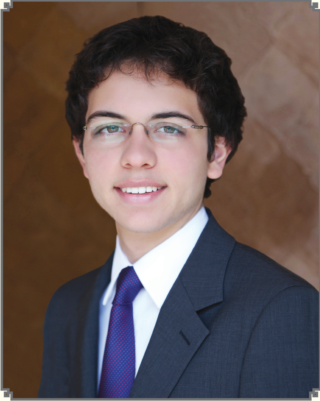
صاحب السمو الملكي الأمير الحسين بن عبد الله الثاني ولي العهد المعظم