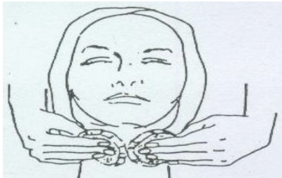
الشكل (٣) : إزالة القناع