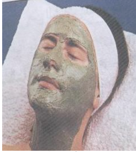
الشكل (١٢) قناع الطحالب

ز- قناع الطحالب algae mask وهو قناع من الطحالب البنية والخضراء التي تحتوي على مادة الكلوروفيل وهو غني بالأحماض الأمينية والمعادن والأملاح والفيتامينات ويساعد على سد المسامات وتنقية البشرة وشدها ويستعمل لجميع انواع البشرة وبخاصة الباهتة وقليلة التغذية كما في الشكل (١٢) .