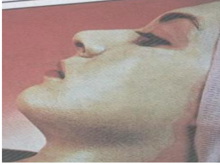
الشكل (٦) القناع العادي

-وفيما يلي بعض أنواع الأقنعة الصناعية وميزاتها ونوع البشرة المستعملة لكل منها مع التوضيح بالرسومات