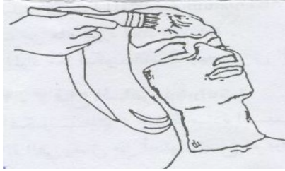
الشكل (٢) : وضع القناع

القناع هو : خليط من المواد يأخذ شكل العجينة ، أو محلول مكثف يتم وضعه على بشرة الوجه ، والعنق باستعمال فرشاة خاصة ويترك لفترة من الوقت حسب نوعه ، والغرض منه يعمل على إزالة الدهون الزائدة والمواد العالقة على سطح البشرة ووضع الأقنعة يعتبر آخر العمليات التي تؤدي إلى تنظيف البشرة ومعالجتها .