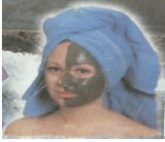
الشكل (١) : القناع الطيني

يرجع استخدام الأقنعة إلى العصور القديمة وانتقلت إلى عصرنا الحالي وأصبحت ذات تراكيب مدروسة ، فكانت من الصلصال أو الطين لقدرتها على لنم الجروح وتنقية البشرة والجسم وشدها ويبين الشكل (١) احد الأقنعة وفي عصرنا الحالي تطور استعمال الأقنعة وتنوعت أشكالها وتركيباتها بهدف تنقية البشرة والمحافظة على صحتها ورونتها ونظافتها .