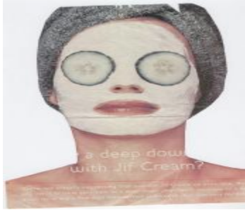
الشكل (٤) قناع طبيعي

وهي الأقمعة التي يدخل بتركيبها مواد طبيعية كمستخلصات النباتات ، وأحماض لفواكه أو التي تساعد على قشط الخلايا الميتة عن سطح البشرة كالخيار والبطاطا والليمون كما في الشكل (٤) والتي تمد البشرة بالعديد من العناصر الغذائية المنشطة والقابضة وتعطي شعورا بالانتعاش . وتستعمل للبشرة الحساسة والجافة والدهنية، والبشرة التي تحتاج إلى الرطوبة، وكذلك للبشرة المتقدمة بالسن .