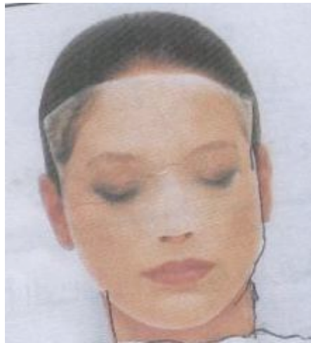
الشكل (١١): قناع الكولاجين

هـ- قناع البودرة powder mask يشكل الكاولين معظمها بالإضافة إلى كربونات المغنيسيوم والنشا وبعض الخمائر ويعتبر منظم ومغذ للبشرة ويستعمل للبشرة الدهنية والمترهلة كما في الشكل (١٠) .