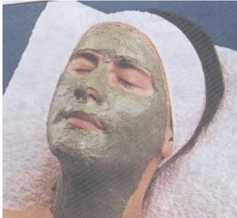
الشكل (٧) القناع الطيني

أ- القناع العادي cream mask وهو مستحلب يتكون من الجلسرين وشمع معسل النحل والأحماض الأمينية ، ومواد مطرية وفيتامينات ويعتبر مغذ للبشرة ويستعمل لجميع أنواع البشرة مع مراعاة درجة الحموضة كما في الشكل (٦)