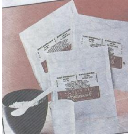
الشكل (١٠): قناع البودرة

د- القناع المطاطي deal mask ويتكون من مواد مطاطية غير نفاذة للماء بالإضافة إلى السوربيتول والكاولين ويعمل على تسخين البشرة مما يؤدي إلى تنشيط الدورة الدموية ويزال كقطعة واحدة عن البشرة ويستعمل للبشرة الشاحبة والمتعبة وقليلة التغذية كما في الشكل (٩) .