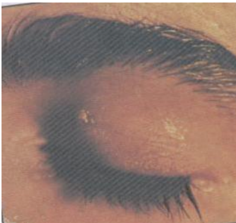
الشكل (٨) القناع الهلامي

ب- القناع الطيني mud mask ويتكون هذا القناع من الكاولين بنسبة ٨٥% مخلوطا بالنشاء بالإضافة إلى الجلسرين والزيوت واكسيد الخارصين وهو غني بالمعادن والكبريت وذو فاعلية في علاج الخدوش وحب الشباب ويستعمل للبشرة المتسخة والدهنية كما في الشكل (٧) .